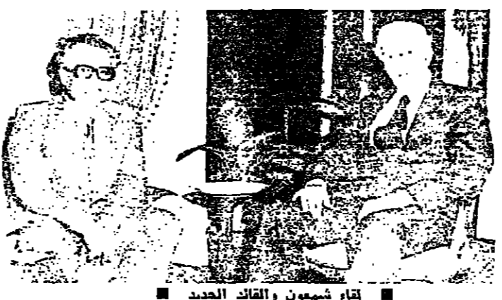
لقاء شمعون والقائد الجديد

ينعقد مجلس الوزراء اليوم وعلى جدول أعماله ثلاث قضايا أساسية: مشروع مرسوم بزيادة رواتب موظفي الدولة - مشروع مرسوم برفع الدرجة الاستثنائية المستحقة للموظفين منذ قرارها قبل الأحداث - رفع الحد الأدنى للأجور في القطاع العام إلى ٢١٠ ليرات. وأما التعديلات الإدارية التي ذكر الحديث عنها في الفترة الأخيرة، فلها ستفكر اليوم على الأقل قبل أن يصبح البيت بها ممكنا، وقد تأخر الإصلاحيات الجارية يشكها بعض الوقت، نظرا لأهمية المركز المتصلة بها، وللتأكدات السياسية التي يمكن أن ترتب عليها. الرواتب والحد الأدنى ولما توقع في تحمل الحكومة في الوقت الحاضر على إعطاء الأولوية لإعادة بناء القطاع العام على أساس واضح، وتخصيص في القروض الخارجية التي تشهد ادارات الدولة بعد الأحداث، وهي مائة إلى مائة مائة من الأحدث في امتدادها الاستثنائي - ارتفاع مستوى المعيشة إلى حد لم تعد معه الوظيفة الرسمية عملا مقولا. وفي اقتراح المسؤولين أن دخول مرحلة الأعمار والاعتماد على كون في أي حال مائة إدارة عاجزة، ويتطلب التضخم لادارة سليمة ومعاصرة، مع البحث عن مصادر التمويل اللازمة. وقد أبلغ الرئيس سليم الحصان اثنين من في الفترة الأخيرة - وأكد لهم بالذات - أن الوضع في وزارتي الاقتصاد والإعلام ملام بعد موقولا، ووصف وزارة الاقتصاد بأنها «بؤرة نساء» (التفاصيل على الصفحة ٢). وكان الحصان قد شدد في نونه التلفزيونية الأخيرة على ضرورة قيام دولة قوية، بإدارة قوية، إذ